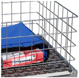
Draadgaasmand voor pakketpost